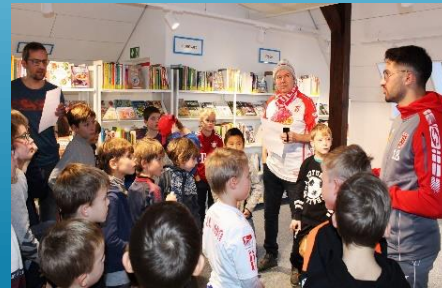
Leseckerle - Thema „Fußball“