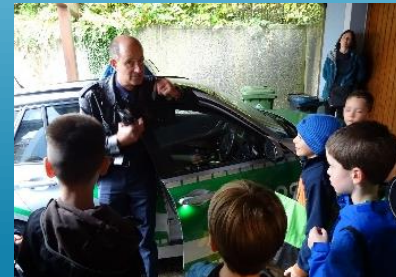
Leseckerle - Thema „Polizei“