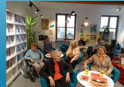
Vorlesestunde mit Senioren