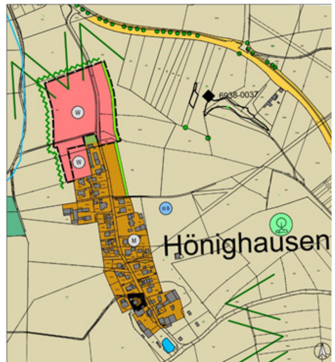
Abb. Auszug 5. Flächennutzungsplanänderung, ohne Maßstab (bearbeitet Ingenieurbüro Eder, Regensburg)

Der räumliche Geltungsbereich umfasst die Grundstücke mit der Flur-Nr. 321 (TF) der Gemarkung Lappersdorf sowie die Grundstücke mit den Flur-Nrn. 205 (TF), 205/2 (TF), 206 (TF), 207 (TF), 208 (TF) und 209 (TF), jeweils der Gemarkung Hainsacker. Der Geltungsbereich, in einem Umfang von ca. 2,7 ha, ist aus dem nachfolgenden Übersichtslageplan ersichtlich.