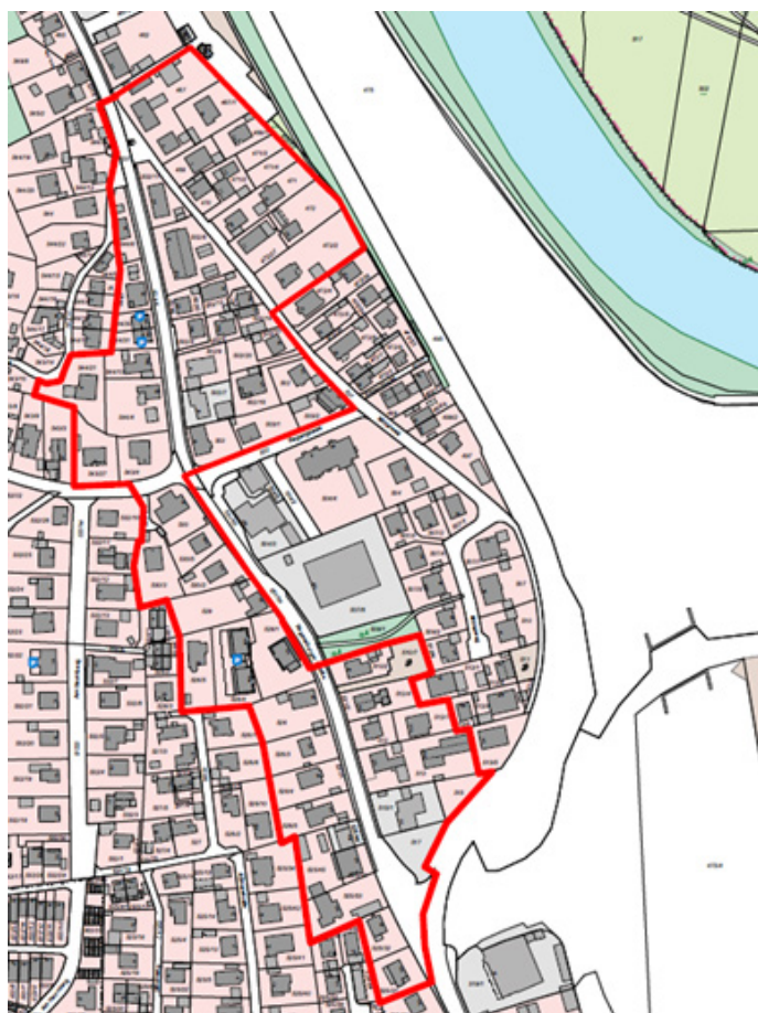
Auszug Lageplan; verkleinerte Darstellung ohne Maßstab; Bearbeitung Markt Lappersdorf

Der Beschluss wird hiermit gemäß § 2 Abs. 1 Satz 2 BauGB öffentlich bekannt gemacht. Der räumliche Geltungsbereich des Bebauungsplans ist aus dem nachfolgenden Übersichtsplan ersichtlich.