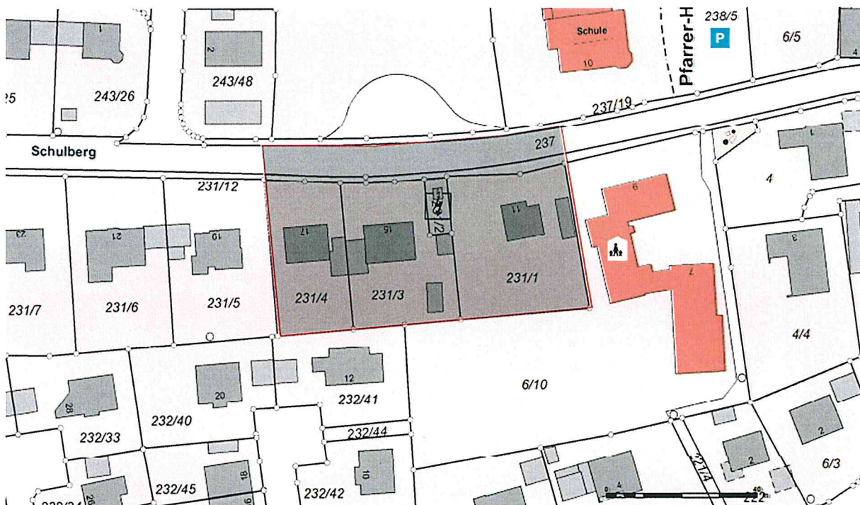
Auszug Lageplan; verkleinerte Darstellung Bearbeitung Markt Lappersdorf

Der räumliche Geltungsbereich des Bebauungsplans ist aus dem nachfolgenden Übersichtsplan ersichtlich.